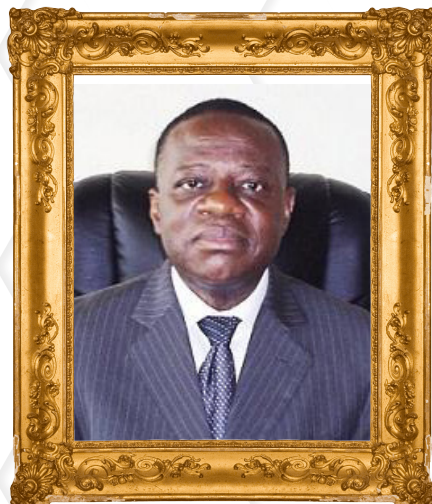
S.E.M. Jacques FAME NDONGO Ministre d'Etat, Ministre de l'Enseignement Supérieur