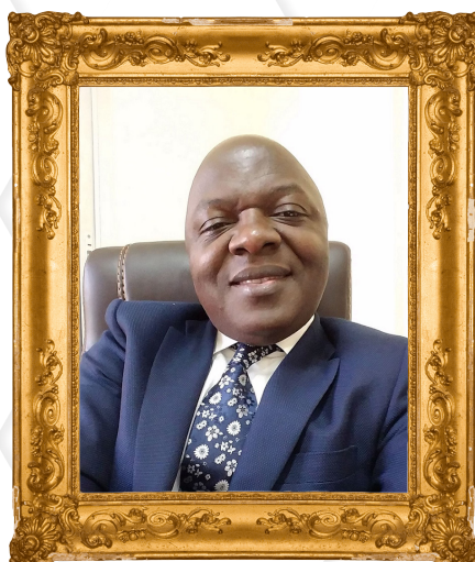
Pr Désiré AVOM Doyen de la Faculté des Sciences Economiques et de Gestion de l'Université de Yaoundé II