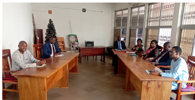
Reunion de travail CEREG-MINPMEESA

En plus des réunions organisées dans ses locaux, les responsables du CEREG ont honoré à plusieurs invitations. Il s'agit de :