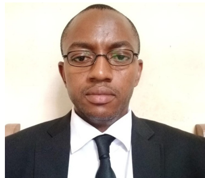
DIRECTEUR DU CEREG

Le Centre d'Etudes et de Recherche en Economie et Gestion (CEREG) , créé par l'Arrêté N°00/0025/MINESUP/SG/DPRC/CJ du 07 AVRIL 2000 , est le tout premier centre de recherche dans les deux disciplines scientifiques que sont l'Economie et la Gestion au Cameroun. Vitrine de la Faculté des Sciences Economiques et de Gestion de l'Université de Yaoundé II en matière de Recherche et Développement en Economie et Gestion, le CEREG continue de se hisser comme un haut lieu de production du savoir scientifique, d'appui-conseil au Gouvernement, d'accompagnement des entreprises publiques, parapubliques et privées, et enfin d'expertise approuvée par les multiples projets socioéconomiques réalisés tant sur le plan national et qu'à l'international. Le CEREG favorise la mise en relation de deux grandes composantes de notre société : celle de la décision publique et privée d'une part, et celle de la réflexion universitaire d'autre part.