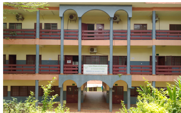
BATIMENT DU CEREG

The Center for Studies and Research in Economics and Management ( CEREG ), created by Decree N°00/0025/MINESUP/SG/DPRC/CJ of 07 APRIL 2000, is the first research centre in the two scientific disciplines of Economics and Management in Cameroon. Torchbearer of the Faculty of Economics and Management of the University of Yaoundé II in terms of Research and Development in Economics and Management, CEREG continues to rise as a hub for the production of scientific knowledge, advisory support to the Government, to public, parastatal and private companies, and finally, the proven expertise evidenced through the multiple socio-economic projects carried out both nationally and internationally. CEREG facilitates the connection between two major components of our society: public and private decision-making on the one hand, and that of academic reflection on the other.