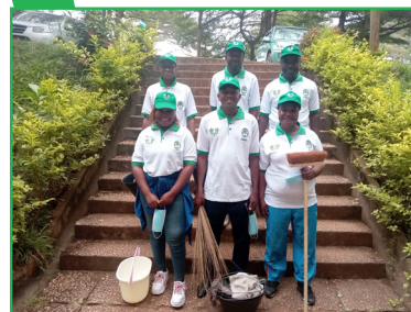
Journées de propreté «Le Vendredi propre »