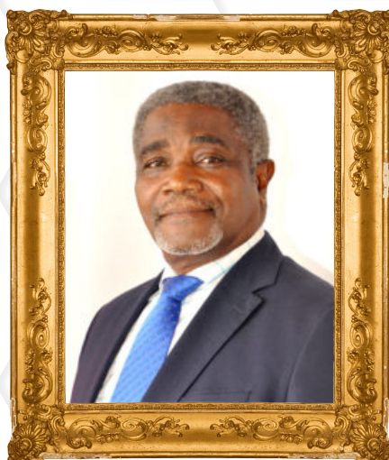
Pr Aldophe MINKOA SHE Recteur de l'Université de Yaoundé II