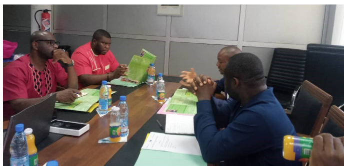
Réunion de travail CEREG-PAK