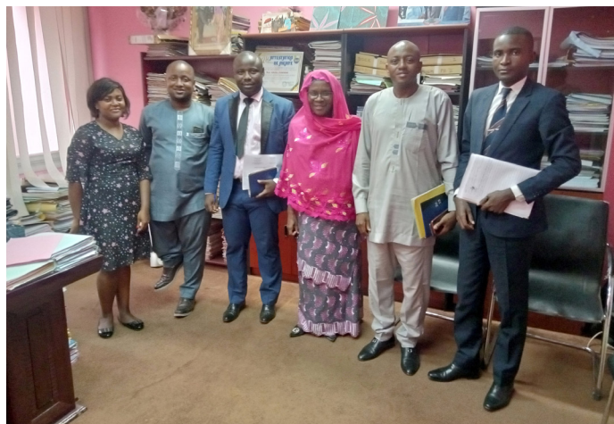
Réunion de travail CEREG-MINCOMMERCE